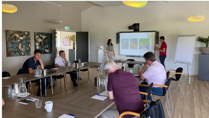
Presentatie HZ studenten

Zoals eerder is gemeld, zijn ook studenten van de Hogeschool Zeeland (HZ) betrokken bij het onderzoek. Op 5 juli hebben ze hun bevindingen gepresenteerd aan de gemeente en de werkgroep waterkwaliteit van de vereniging.