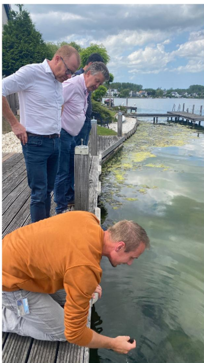
Overleg waterschap, gemeente, vereniging op locatie.

De kwaliteit van het water is goed, dat wil zeggen: het is Helder, Zilt en Gezond. Dat zijn de doelstellingen die we vanaf het begin hebben neergezet. Maar het is belangrijk dit zo te houden. Ook als we weer een warme periode ingaan. Tijdens de zomermaanden zullen de metingen doorgaan en zal ook de situatie nauwlettend in de gaten worden gehouden. Mocht er aanleiding toe zijn dan zal het wier worden verwijderd. De gemeente en een aannemer staan klaar om dit te doen. Tijdens het recente overleg "op locatie" is dit verder afgestemd.